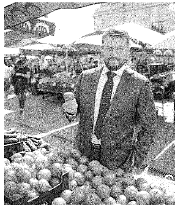
Latvijas Republikas 12. Saeimas deputāts Andris Morozovs

Nobeigumā novēlu Rīgas Centrāltirgus komandai izpildīt izvirzītos uzdevumus un sasniegt nospraustos mērķus!