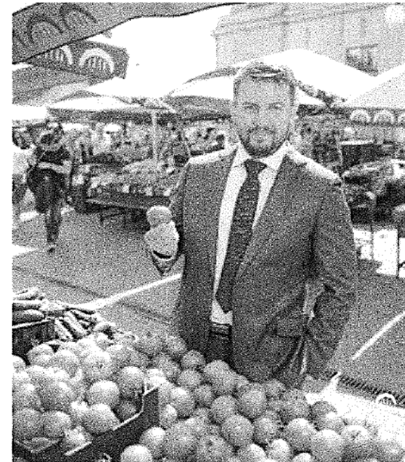
Latvijas Republikas 12. Saeimas deputāts Andris Morozovs

Nobeigumā novēlu Rīgas Centrāltirgus komandai izpildīt izvirzītos uzdevumus un sasniegt nospraustos mērķus!