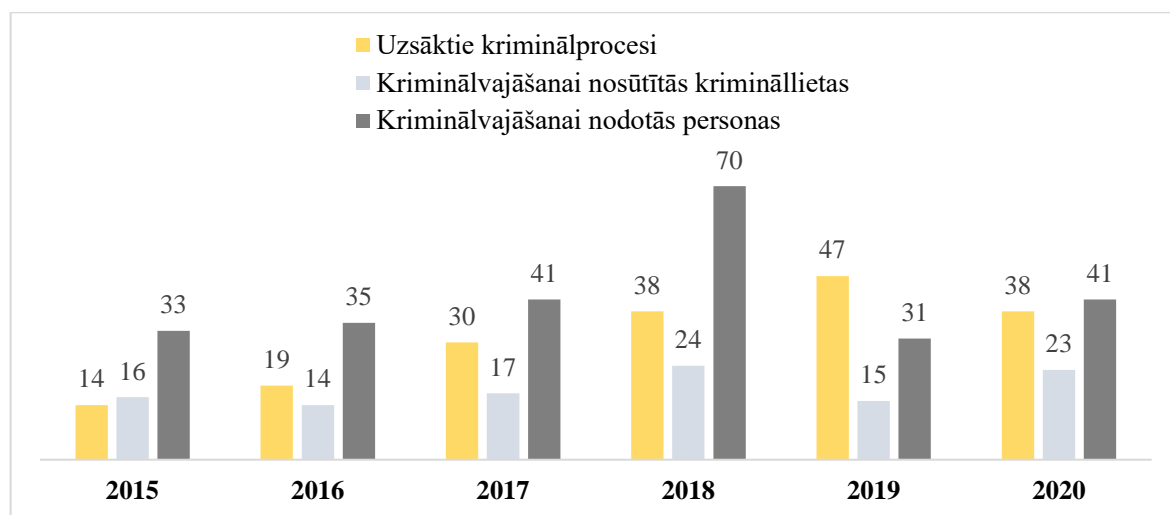
2. attēls. Uzsākto kriminālprocesu, kriminālvajāšanai nosūtīto krimināllietu un personu skaits

Tomēr KNAB darba rezultātu kāpināšana nav spējusi būtiski uzlabot KUI 58 rādītāju. 2020. gada KUI novērtējumā Latvija saņēmusi 57 punktus no 100, ierindojoties 42. vietā no 180 pasaules valstīm (skat. 2. tabulu). Lai arī šis rādītājs ir nedaudz uzlabojies, salīdzinot ar 2019. gada kritumu, tas nesasniedz cerēto izaugsmi, turklāt tikai par diviem punktiem pārsniedz 2015. gada rādītāju. Tas liek domāt, ka 2024. gadā Latvijas Nacionālajā attīstības plānā 2021.–2027. gadam izvirzītais progresa rādītājs, kas saistīts ar korupcijas uztveri, nesasnies mērķa vērtību, t.i., 64 punktus.